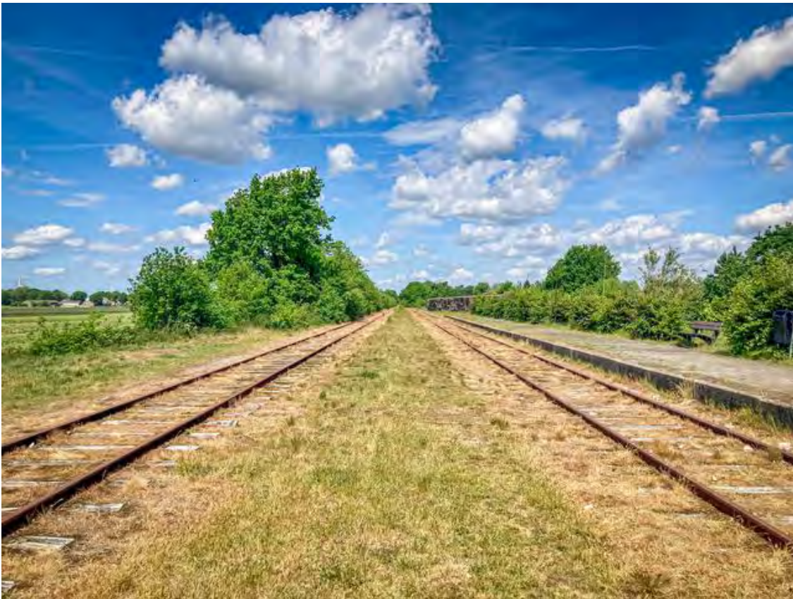
Tussenstation Musselkanaal, stopt hier straks de Nedersaksenlijn?

Bijvoorbeeld tussenstation Musselkanaal. Van de overweg bij de Rubings is het voor de Nedersaksenlijn straks nog een paar kilometer naar dat station. Het perron ligt er nog. Treinen komen hier al lang niet meer, de laatste echte trein vertrok er in 1953. Het bordje met de naam van het station is ook al weg. Het oude station zelf trouwens ook. Maar met enige fantasie zie je hier van stoom dampende locomotieven elkaar fluitend passeren op het dubbele spoor. Het geluid erbij verzinnen is al ietwat lastiger, kikkers kwaken dat het een lieve lust is in een oude veenwijk. Gras en struikgewas groeien ongestoord tussen vergane bielzen en afgesleten spoorrails. Ook de Stationsstraat die leidt naar de plek, verraadt dat er in een vergeeld verleden hier van alles tussen de rails gebeurde.