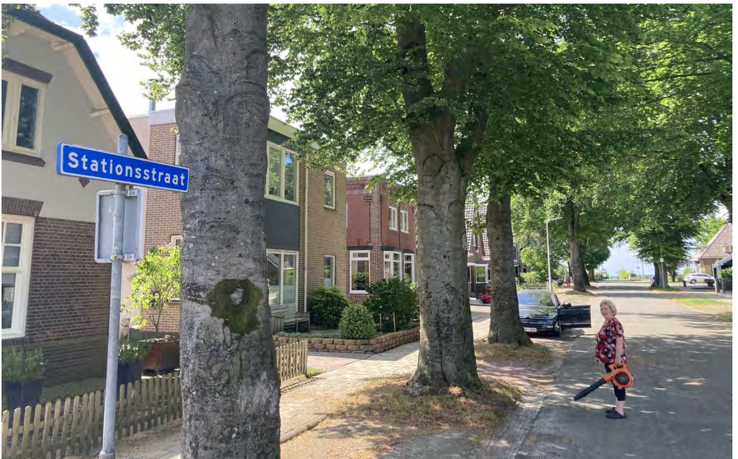
Erica Wiering in de Stationsstraat in Musselkanaal zonder station.

Woensdag is de dag van de Nedersaksenlijn. Experts verzinnen dan kansen om de spoorlijn Groningen-Enschede naar een hoger plan te tillen. Hoe leeft het in Musselkanaal, een tussenstation? „Ik woon al 75 jaar naast de spoorlijn en heb nog nooit een passagierstrein gezien. En die ga ik ook niet zien.”