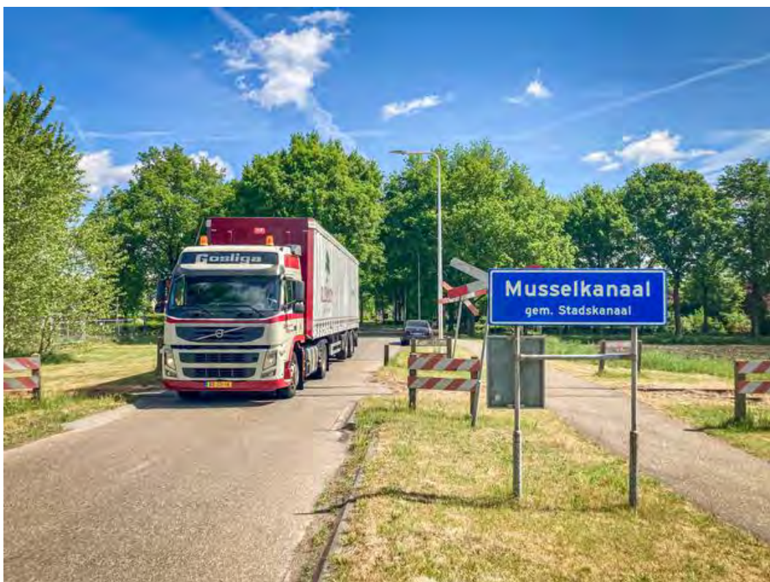
De onbewaakte overweg tussen Eerste Exloërmond en Musselkanaal.

Nou, Lotte wel. Ze laat in de Stationsstraat de hond uit. De student creative business aan de NHL in Leeuwarden is bij haar ouders. Ze weet van het bestaan van de prille plannen voor de Nedersaksenlijn en denkt dat jongeren het welk tof zouden vinden, een trein van Groningen via Musselkanaal naar Emmen en dan door naar Enschede. „Ik ga nu met de bus naar Groningen en met de trein naar Leeuwarden. Het zou nu al tof zijn als dat met de trein kon.”